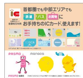
ポケットティッシュのデザイン