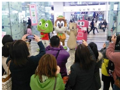
昨年12月に実施した九州エリアでの様子

「PASMO」・「manaca (マナカ)」・「TOICA」は、鉄道やバス、商業施設などにご利用いただけるICカードです。